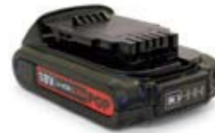
2.0Ah battery with charge indicator